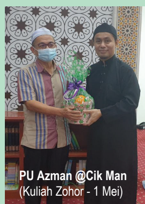
PU Azman @Cik Man (Kuliah Zohor - 1 Mei)