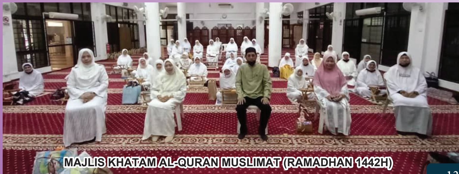
MAJLIS KHATAM AL-QURAN MUSLIMAT (RAMADHAN 1442H)