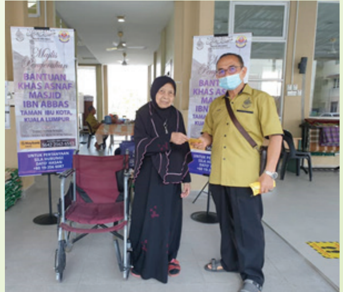
'Program Khas Asnaf Masjid Ibn Abbas' kerjasama antara Masjid Ibn Abbas dan Surau An-Nur Fasa 7 telah diadakan pada 20 Mar 2021 bertempat di Surau An-Nur Fasa 7. Sumbangan yang diberi adalah dalam bentuk barangan keperluan dapur serta wang saku. Seramai 40 orang penerima hadir pada hari serahan tersebut.