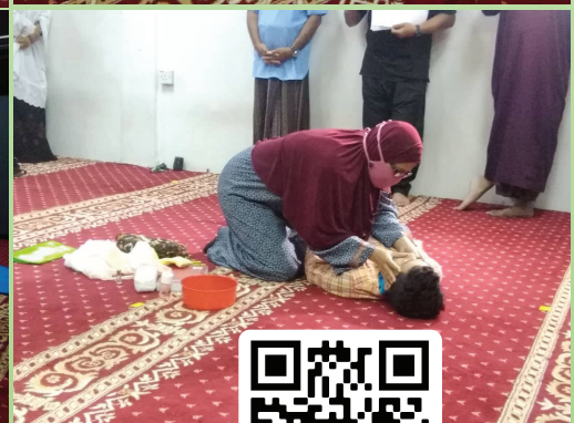
Sebahagian dari penggambaran video cara-cara pengurusan awal menguruskan jenazah jika berlaku kematian dirumah.