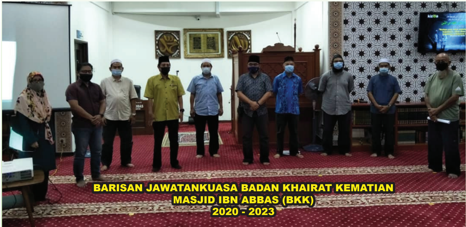
BARISAN JAWATANKUASA BADAN KHAIRAT KEMATIAN MASJID IBN ABBAS (BKK) 2020 - 2023