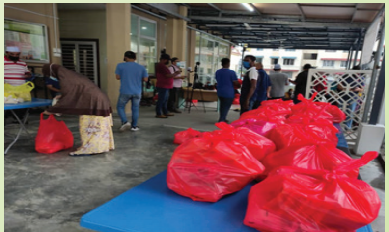
MIA bekerjasama dengan Yayasan Pelindung & Kesedaran Pencegahan Jenayah Malaysia dan AJK Surau An-Nur Fasa 7 dalam menyampaikan 50 pek makanan serta keperluan dapur kepada 50 orang asnaf terpilih. Majlis berlangsung di Surau An Nur Fasa 7 pada 15 April 2021 selepas solat Asar.